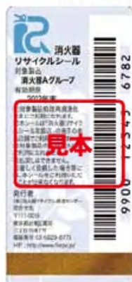
リサイクルシール

平成22年以降に製造された消火器は、リサイクルシールが貼られて販売されています。リサイクルシールを貼られていない既存の消火器は、シールを購入し貼付してから回収窓口へ引き渡します。